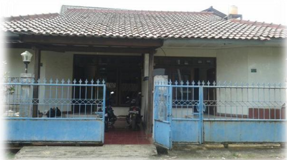
Foto: Rumah baru lofC Indonesia

Setelah 7 tahun rumah lama lofC Indonesia, dan 1,5 bulan mencari rumah baru, serta melalui doa dan dukungan rekan-rekan semua, akhirnya lofC Indonesia menemukan rumah baru. Menyewa rumah ini merupakan bagian dari tujuan jangka pendek lofC Indonesia sebelum kami memiliki rumah permanen lofC Indonesia.